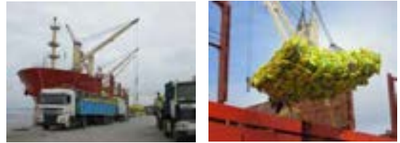
コメ(袋詰め)の荷役 バルク船からロープにて積みおろし