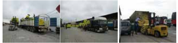
岸壁でのトラックへの積み込み